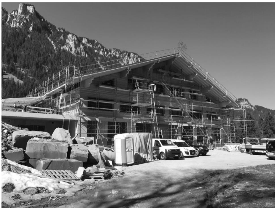
Schulanlage Wiriehorn, Stand 16. März 2017. Weitere Bilder finden Sie auf www.diemtigen.ch

Beat Stucki aus Entschwil wurde zum neuen Schulhauswart der Schulanlage Wiriehorn und der Sporthalle Diemtigtal gewählt. Er tritt die Stelle am 1. Juni 2017 an.